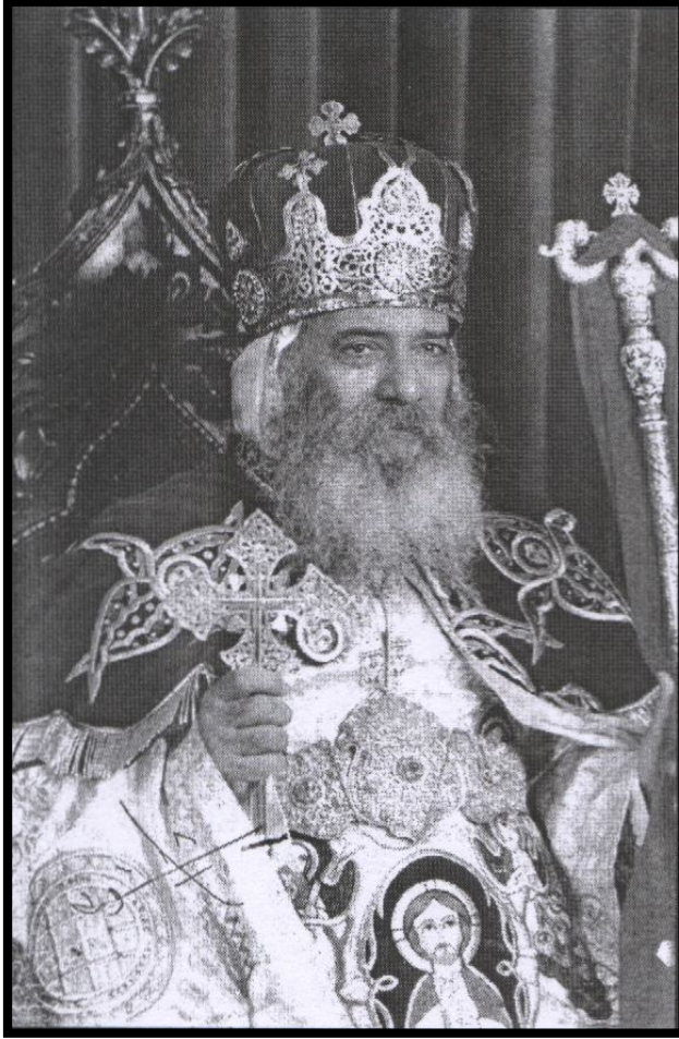
صاحب القداسة الأنبا شنودة الثالث بابا الإسكندرية وبطريك الكرازة المرقسية